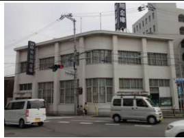
京都中央信用金庫 徒歩1分(60m)