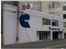
京都信用金庫 徒歩1分(50m)