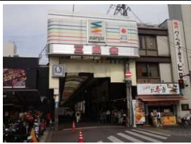
三条会商店街 徒歩1分(50m)