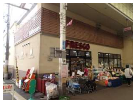
スーパーフレスコ 徒歩2分(140m)