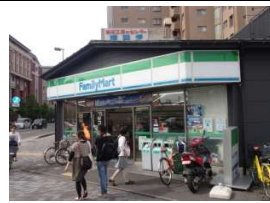
ファミリーマート 徒歩1分(80m)